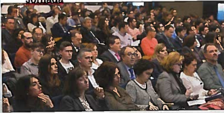
Público asistente a la jornada 'FP Dual y Empresas: una alianza de éxito'.